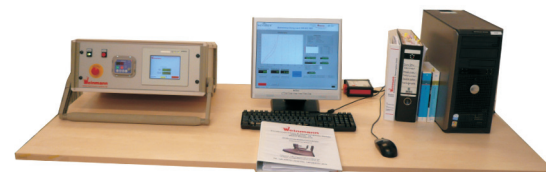
PLC control box mit PC Kundenbeistellung